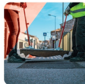
ÉTAPE 4 Possibilité de manipuler avec 2 MINI-LIFTPLAQ®+