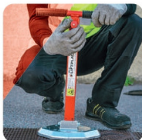
ÉTAPE 1 Ajuster le manche à l'aide du bouton de réglage