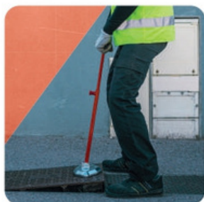
ÉTAPE 2 Aimanter au bord, lever légèrement et tirer en faisant glisser la plaque au sol